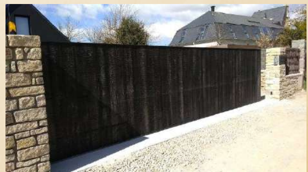
Portails coulissant en bois brûlé