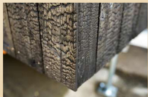
Bardage en bois brûlé utilisé pour la réalisation d'une Tiny House

Nous avons réinterprétés cette technique traditionnelle et artisanale avec la spécificité des bois thermo chauffé.