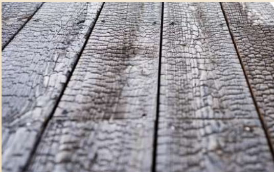
Bardage en bois brûlé utilisé pour la réalisation d'une Tiny House

Cette technique originaire du Japon s'est développée à partir du XVIIIème siècle.