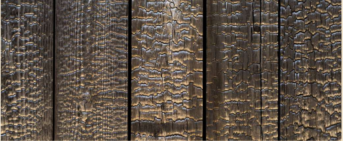
Bardage en bois brûlé utilisé pour la réalisation d'une Tiny House

Le bois brûlé est réalisé avec une technique japonaise ancestrale appelée Shou Sugi Ban ou Yakisugi. Cette technique est réalisée sur du Pin Maritime T.H.T.